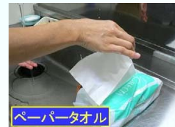
8. 清潔なタオル等 で十分に拭き取る