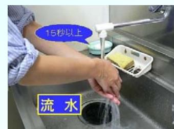
7. 流水で洗 い流す