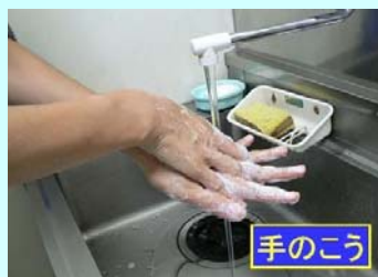
2. 手の甲を伸ば すように洗う