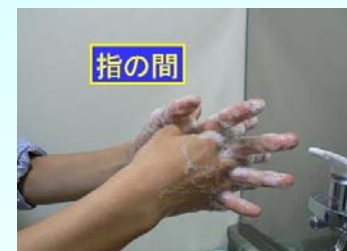
4. 指のあいだ を洗う