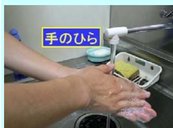
1. 手のひらを合 わせて洗う