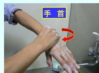
6. 手首も忘 れずに洗う