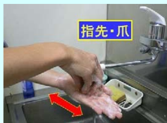
3. 指先、爪先 の内側を洗う