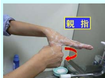
5. 親指と手のひら をねじり洗い