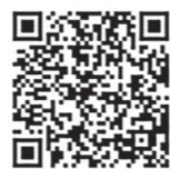
▲国税庁公式 LINE アカウント