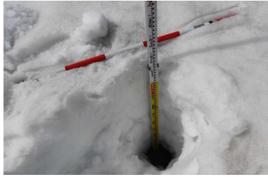
計測地の地面が見えるもの